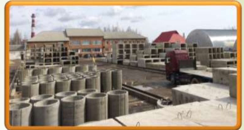
Производство строительных материалов на основе цемента

Спасск-Дальний - центр производства современных строительных материалов Приморья