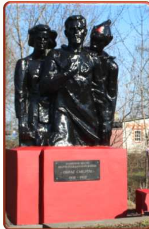
Реставрация памятного места «Овраг смерти»