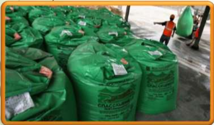
Производство минеральных удобрений

Спасск-Дальний - центр производства современных строительных материалов Приморья