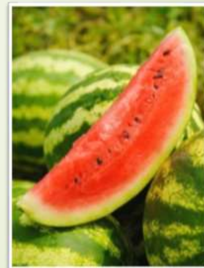
Сельское хозяйство (клубника, томаты, арбузы)